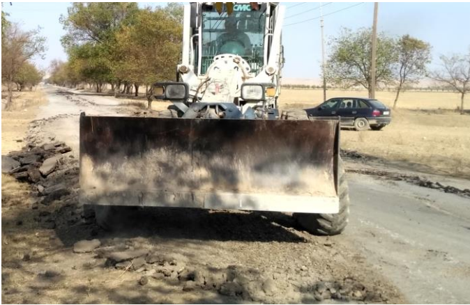
Оғози таъмири роҳҳо тариқи дастачамбона