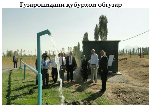
Гузaronидани кубурҳои обгузар